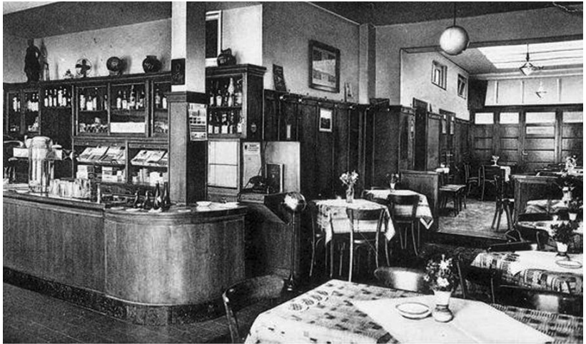
Gasthaus zum Laacher See, 1965

Haus und untervermietete es dann an Verwandte und Landsleute und es eröffnete dann ein Gemüseladen im Erdgeschoss. Wegen Unregelmäßigkeiten wurde das Mietverhältnis aber beendet und Wolfgang Becker nahm die Vermietung in eigene Hände.