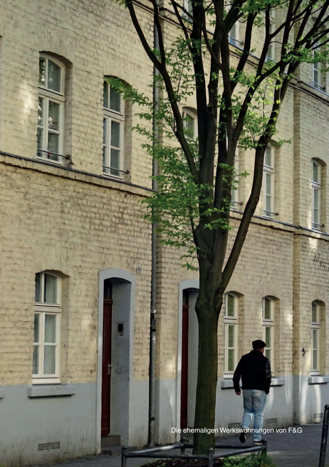
Die ehemaligen Werkwohnungen von F&G