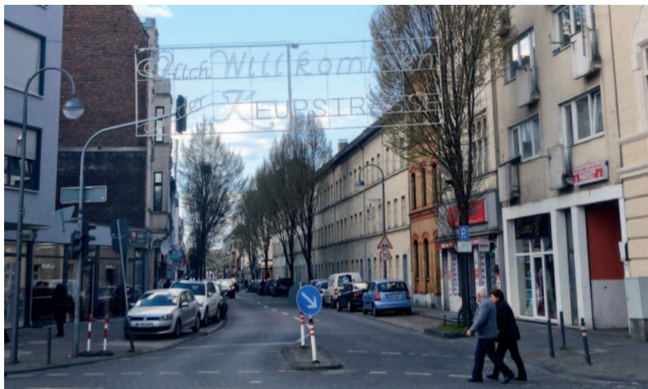
Östliches Ende der Keupstraße, 2016

Warmmiete pro Monat ist sie zu teuer. Dazu kommen die Probleme mit der allgegenwärtigen Bürokratie, die wegen ungenügender Sprachkenntnisse schwer zu bewältigen sind. Und nicht zuletzt fühlen sie sich in der Keupstraße nicht willkommen: „ Letzthin, als ich auf der Keupstraße mit einem türkischen Bekannten sprach, kam ein anderer Türke und warf mir vor: ‚Ihr habt die Keupstraße versaut!‘ “