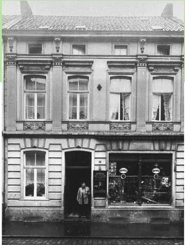
Keupstraße 27, 1926