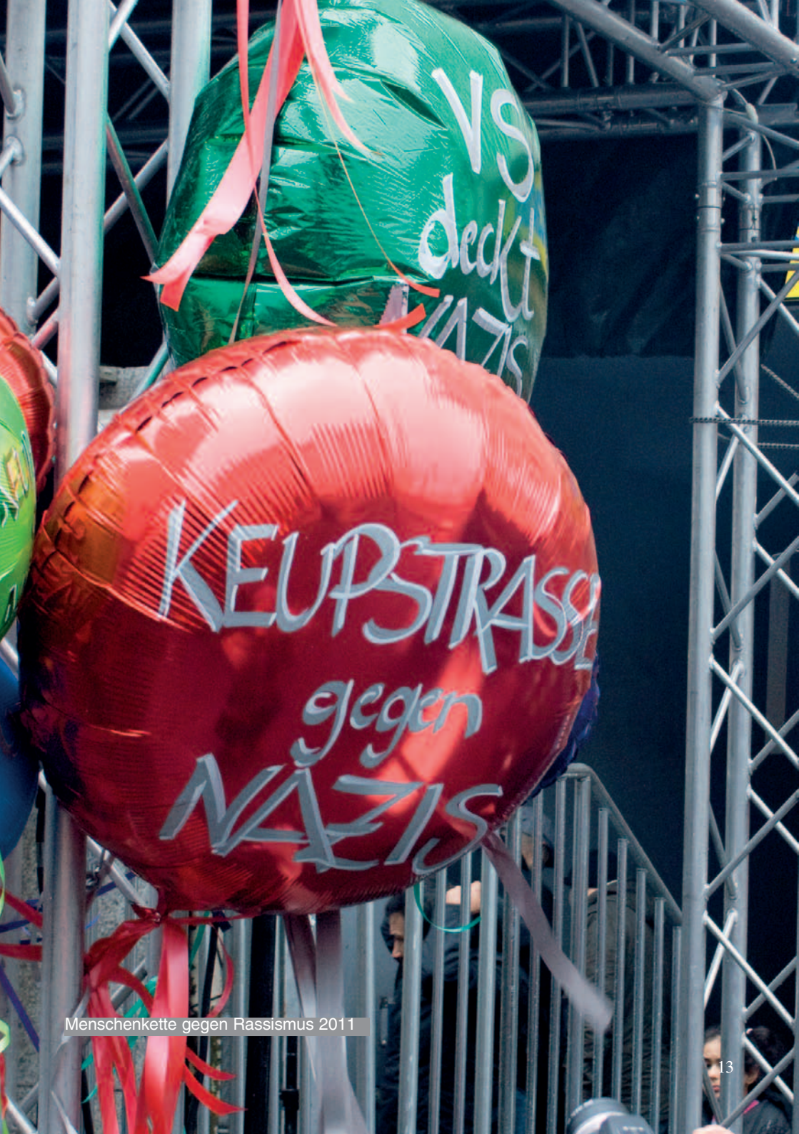
Menschenkette gegen Rassismus 2011