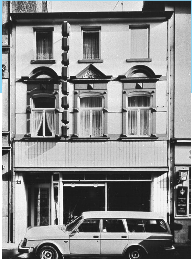
Keupstraße 23, 1976

Das junge Paar hatte 1992 – nach gründlicher Marktanalyse in der Keupstraße und