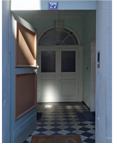
Der Eingang zur Nr. 27

ung des Nagelbombenanschlags des NSU, der daraufhin einsetzenden öffentlichen Aufmerksamkeit und den Solidaritätsbekundungen. Thomas Schallbergs Druckerei liegt direkt neben dem Kuaför, vor dessen Laden die Bombe explodierte. Durch