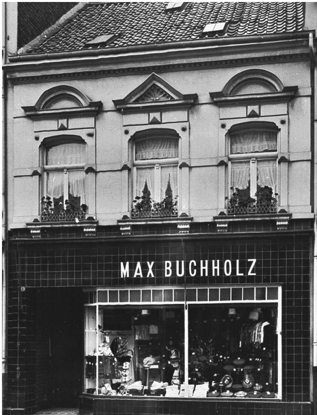
Keupstraße 23, 1926

Auch die Fruchtgummis, die er von den Vermietern, einem älteren deutschen Ehepaar bekam, sind eine bleibende Erinnerung, und der kleine Blumenladen an der Ecke, wo sein erster deutscher Freund zu Hause war. Wie haben sie sich denn damals verständigt? „Mit Händen und Füßen, wie Kinder sich halt verständigen, und nach drei Monaten Ferien