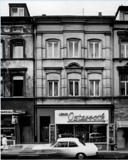
Keupstraße 68, Lederwaren Osterroth

kleinen Garten. Dort wuchs Gemüse, und wir hatten auch Kaninchen.“