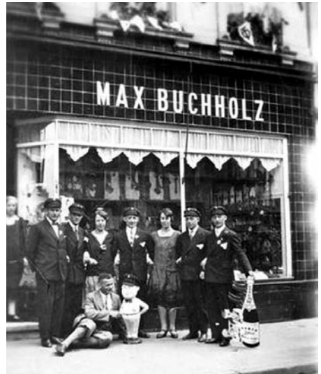
Keupstr. Nr. 23, 1928