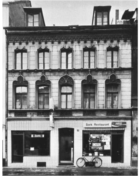
Keupstraße Nr. 50 im Laufe von fünfzig Jahren: rechts 1927, links 1977, unten 2016