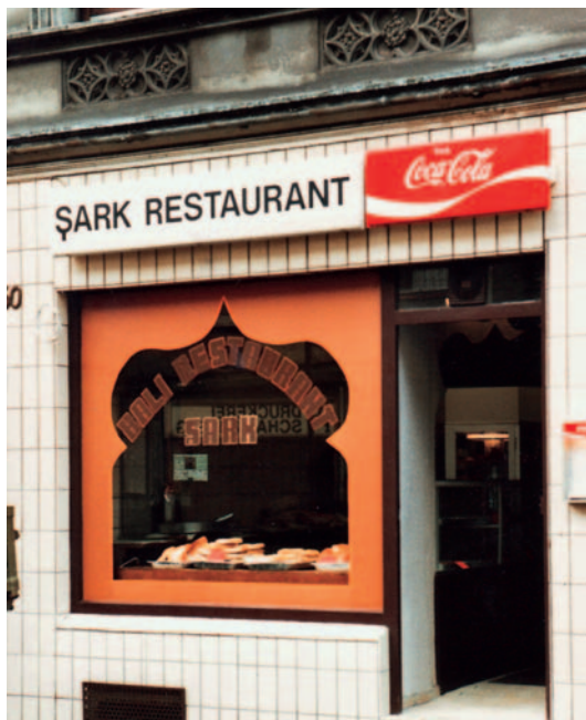
Sark Restaurant 1970

Verständnis für ihre schwierige Lage und ihre dringende Bitte, man möge ihren Mann zurückkommen lassen. Man riet ihr, sie könne sich ja scheiden lassen und einen anderen Mann heiraten! Erst Mitte der 80er