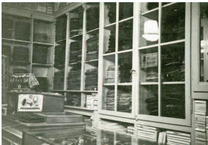
Die Nr. 23 1930 innen