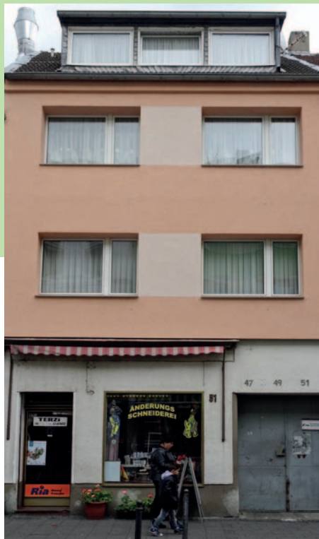
Keupstraße 51, 2016