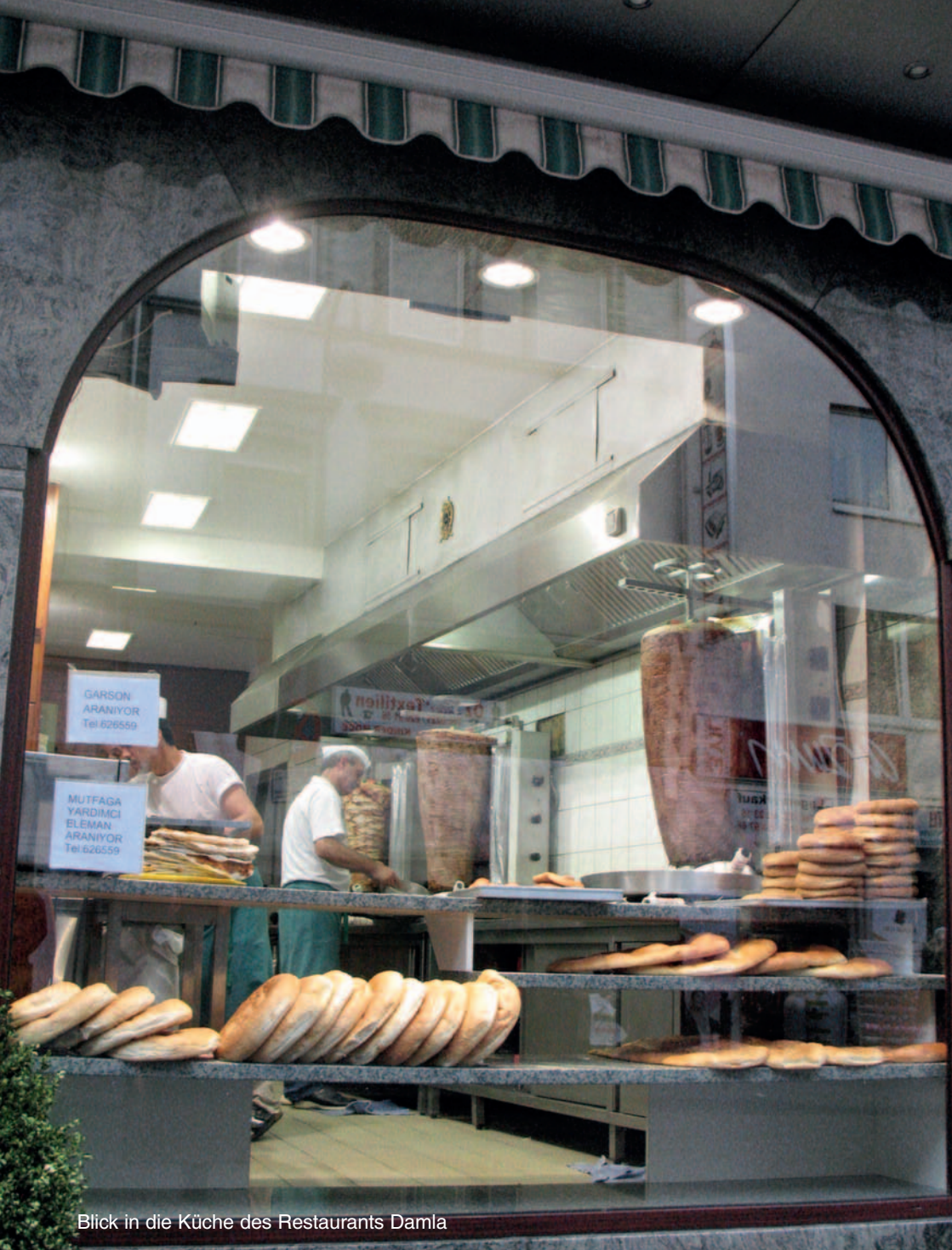
Blick in die Küche des Restaurants Damla