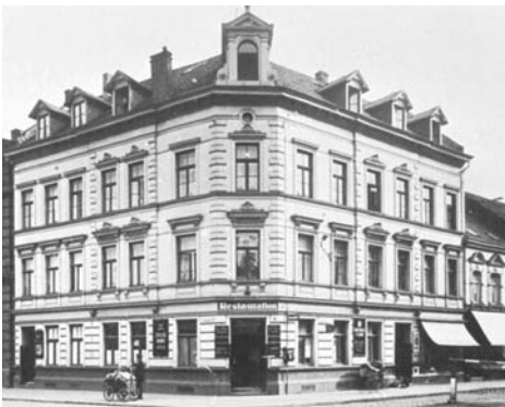
Keupstraße Ecke Schanzenstraße 1926

Mit dem Wachsen des Carlswerks zum bedeutendsten Kabelwerk des Kontinents kam auch der Wohlstand in diesen Teil der Keupstraße. Von 1911 bis Ende der 20er Jahre fuhr sogar eine Straßenbahn von der Mülheimer Freiheit bis zum Mülheimer Bahnhof durch die gesamte 890 m lange Keupstraße. Zwischen der Schanzenstraße und der Bergisch-Gladbacher Straße wurden Wohn- und Geschäftshäuser gebaut, in denen Kleingewerbetreibende und Laden-