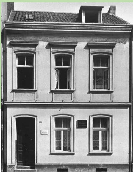
Keupstraße 51, 1926