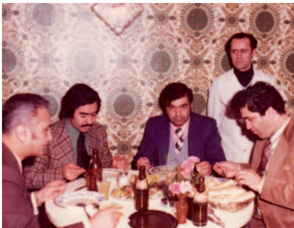
Sark Restaurant 1970