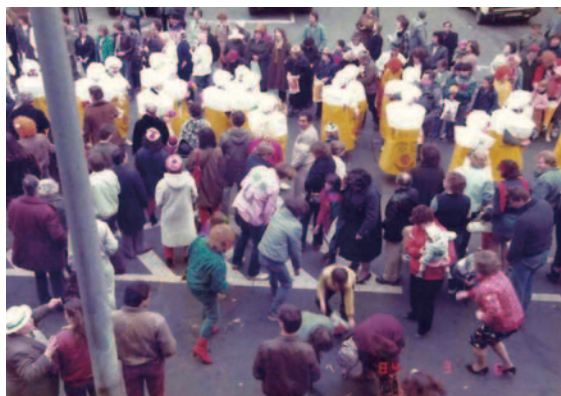
Karneval in der Keupstraße 1981