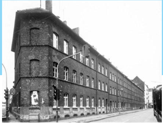
Keupstraße 97 – 117, 1975

A.N. gehört zur muslimisch-türkischen Minderheit, die vor allem gegen Ende der kommunistischen Herrschaft unter Todor Schiwkow (1954 bis November 1989) unter mannigfaltiger Repression zu leiden hatte: zum Beispiel mussten sie ihre türkischen Namen ablegen, durften kein Türkisch sprechen, und alle türkischen Schulen wurden geschlossen. 380.000 von ihnen wurden in Arbeitslager verschleppt und zur Auswanderung gezwungen, die auch nach dem Machtwechsel im November 1989 anhielt. Über 150.000 muslimische bulgarische Staatsangehörige sind