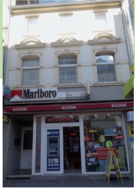
Keupstr. Nr. 23 heute

Als die Bombenangriffe auf Köln zunahmen, zog die Familie nach Hoffnungstal, wo sie bis zum Kriegsende blieb. Auch ihr Haus in der Keupstraße wurde von einer Bombe getroffen, aber durch das schnelle Eingreifen des Chefs der Werksfeuerwehr von F & G – mit dem die Familie befreundet war – konnte der Brand schnell gelöscht werden. Der Vater kehrte 1945 nach kurzer amerikanischer Gefangenschaft aus Andernach zurück, und bald nach dem Krieg und den Aufräumarbeiten öffneten viele Geschäfte in der Keupstraße wieder. In den 50er Jahren existierten in fast jedem Haus Ladengeschäfte, darunter auch eine ganze Anzahl Textilgeschäfte. So eröffnete die Tante im Anbau des Hauses Nr. 23 zunächst ein Geschäft für Taschen und danach für Spielwaren. Später verlegte sie den Laden in das „Hutzelhäuschen“, direkt gegenüber auf der anderen Straßenseite, nachdem das