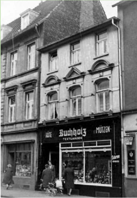
Keupstr. Nr. 23, 1955

Die gemeinsame Toilette war im Zwischengeschoss des Anbaus.