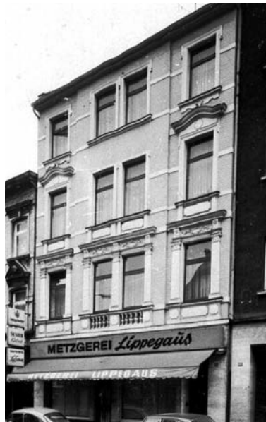
Metzgerei Lippegaus, 1975

Fernsehserie wurden. Im ehemaligen Fotoladen Penningsfeld in der Nr. 58 ist jetzt ein Import-Exportgeschäft. Um sich von seinem Onkel in der Frankfurter Straße abzugrenzen, nannte der Sohn sein Geschäft Foto-Gregor am Neumarkt. Sehr lange hat sich das Lederwarengeschäft Osterroth in der Nr. 68 gehalten, das dann vorübergehend von einem Bordell abgelöst wurde. Mit der Gaststätte Kühbach in der Nr. 69 schloss die letzte deutsche Kneipe in der Keupstraße.