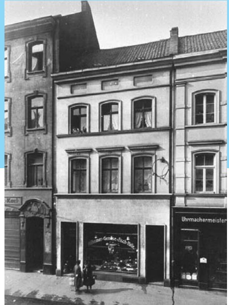
Keupstraße 68 – 72, 1927

1962 heiratete er und verließ die Keupstraße, aber seine Mutter hat hier bis zu ihrem Lebensende gewohnt. Da er bei Felten &