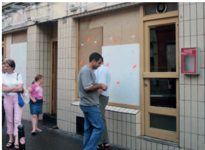
10.6.2004 – am Tag nach dem Anschlag

Zugegeben, es war nicht immer friedlich und harmonisch. In den 70er Jahren gab es in den deutschen Kneipen öfters Schlägereien „mit Äxten und Messern“. Meist ging es dabei um Frauen, und oft waren Zuhälter beteiligt, anfangs Deutsche, später Türken. In den 80er Jahren kamen dann viele neue türkische und kurdische Zuwanderer, viele davon illegal, und einige von ihnen verdienten ihr Geld mit Drogenhandel und anderen kriminellen Aktivitäten. Es gab auch