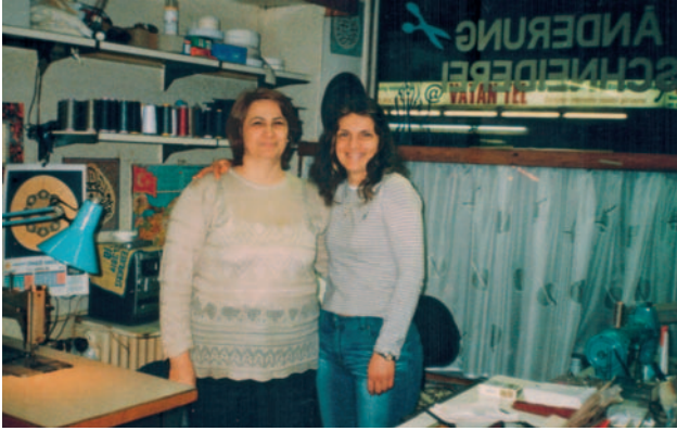
In der Schneiderei 2004 mit einer Freundin

Das Geschäft läuft gut, immerhin hat sie 33 Jahre Berufserfahrung und inzwischen eine feste Stammkundschaft.