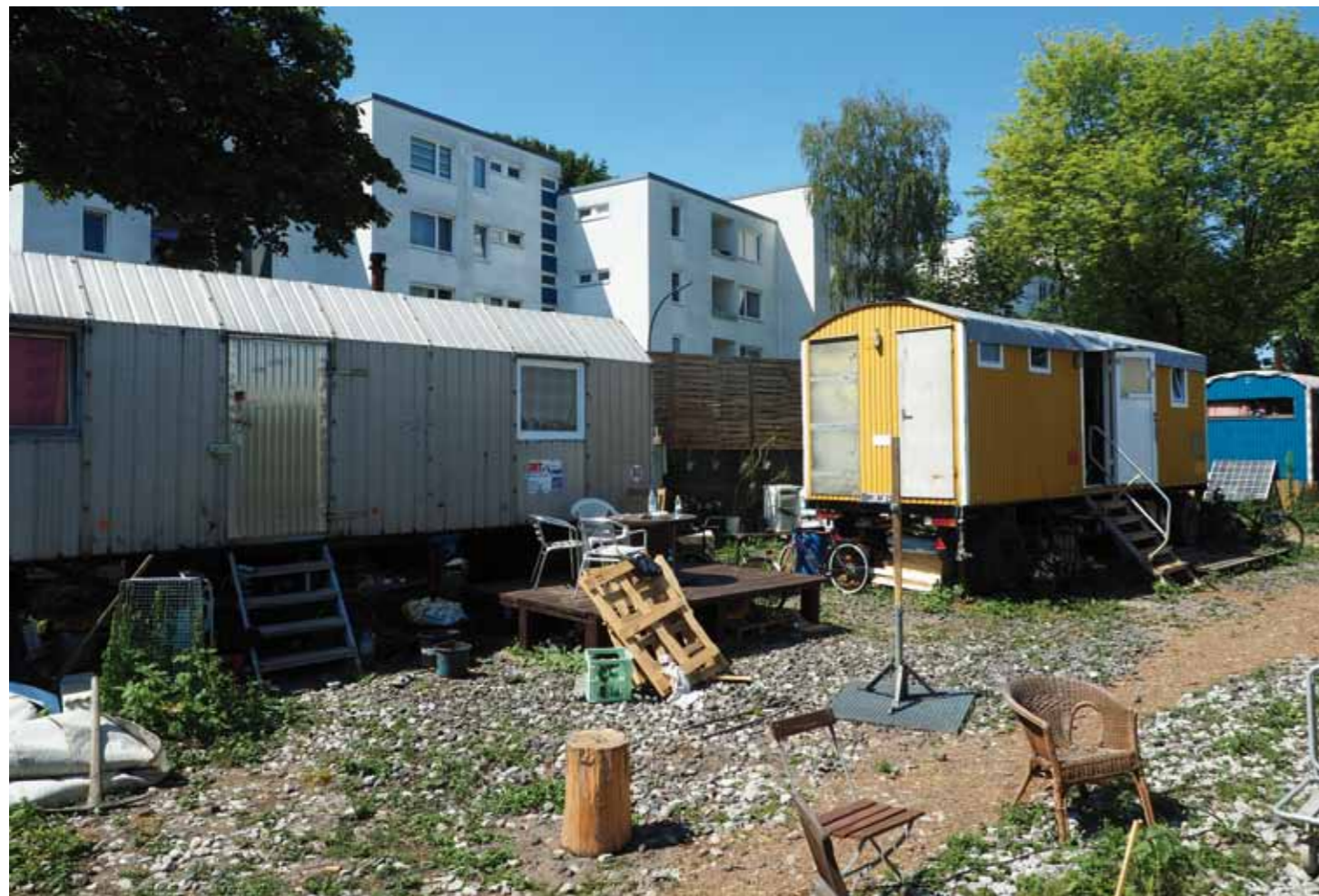
Bauwagen und Bauhaus