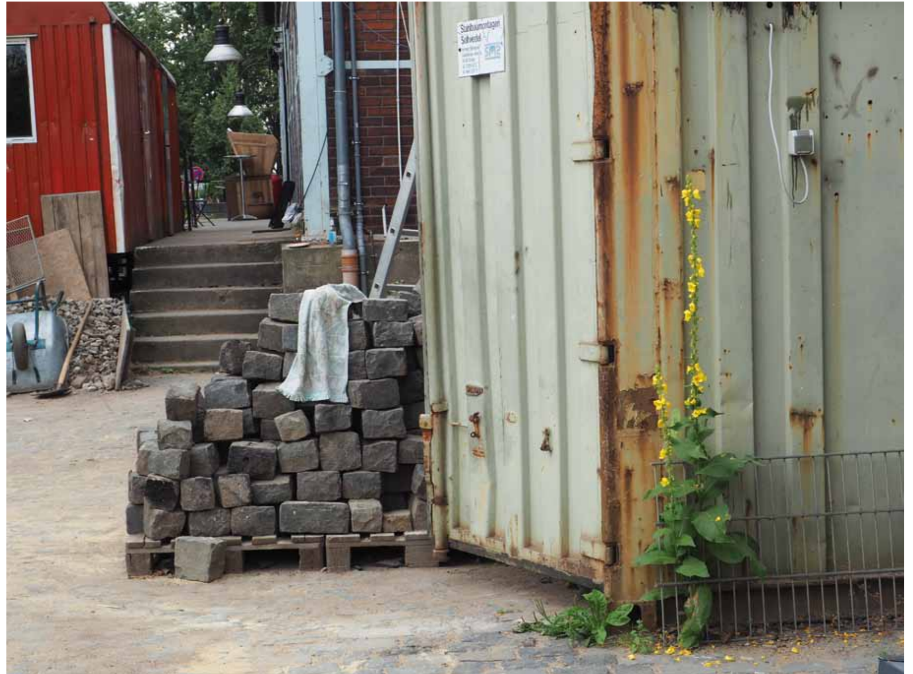
Impression von der SSM-Baustelle »Am Faulbach«

Der städtische Investitionszuschuss von 170.000 Euro an den SSM bedeutet echte Hilfe zur Selbsthilfe. Wir sehen ihn als Auftakt für Köln und anderswo, ausgegrenzten Menschen, die sich im Hartz-IV-Bezug passiv und ohnmächtig fühlen, endlich eine selbstbestimmte Lebensperspektive geben zu können. Damit knüpft die Stadt Köln wieder an die Sozialpolitik der späten Weimarer Republik an, wo Menschen, die in elendigen, krankmachenden Behausungen wohnen mussten, sich selbst mittels Muskelhypothek neuen eigenen Wohnraum bauen konnten.